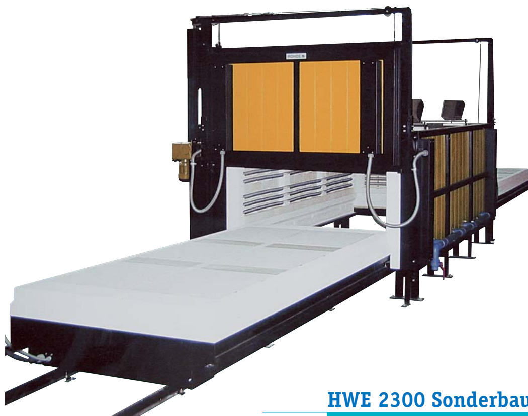
HWE 2300 Sonderbau

Die ROHDE Elektro-Herdwagenöfen sind für einen langjährigen Dauereinsatz im Werkstatt- und Industriebetrieb konzipiert. In puncto Technik und Sicherheit entsprechen sie dem neuesten Stand. Individuelle technische Ausstattungen sind jederzeit möglich.