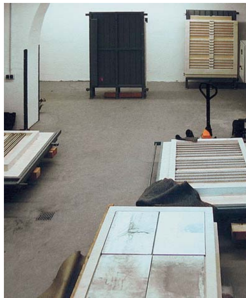
Alle Module vor Ort